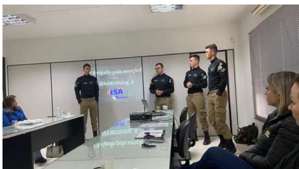
Reunião com a participação de técnicos de segurança que falaram sobre primeiros socorros.