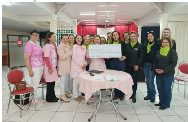
Campanha “Livro de Ouro 2023”, destinado à Rede Feminina de Combate ao Câncer de Canoinhas