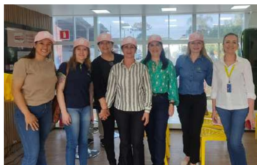
Painel Mulheres no Topo, do Banco do Brasil. Fala sobre atuação da Mulher no mercado de trabalho.