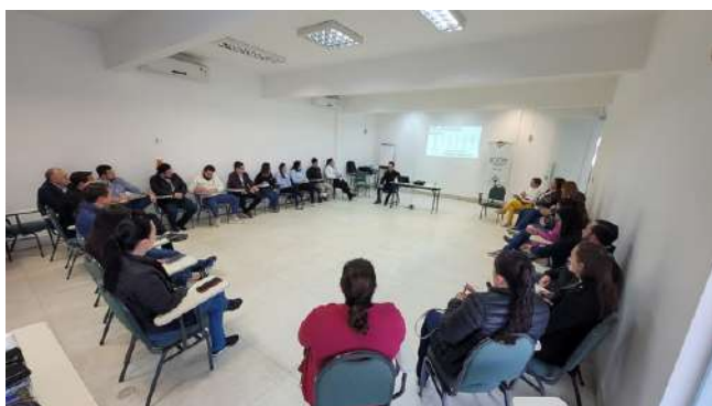
Palestra Recrutamento e Seleção