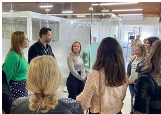
Reunião na Sicoob e visita técnica nas instalações da cooperativa de crédito.