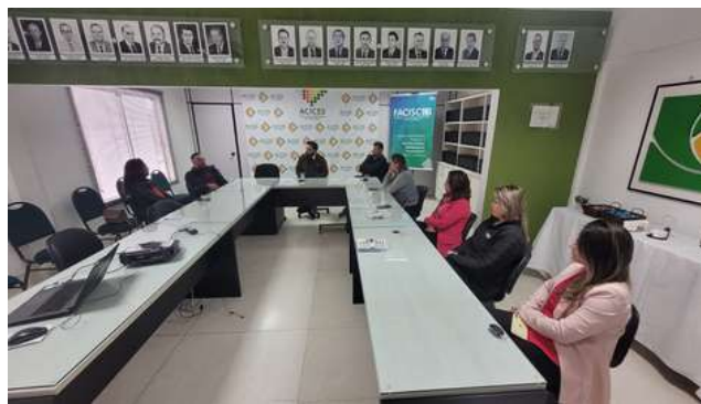
Legislação Trabalhista e Compliance