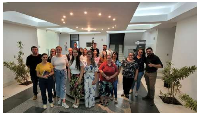
Palestra Recrutamento e Seleção