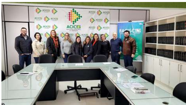
Reunião de Trabalho

O Núcleo de Gestão de Pessoas da ACIC reúne profissionais da área de recursos humanos para discutirem melhorias no processo de recrutamento e seleção, gestão de benefícios e capacitações conjuntas.