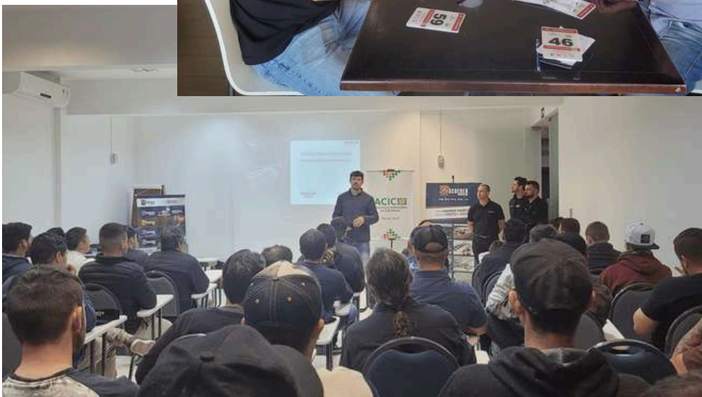
Palestra Técnica Monroe, parceria NACT e Scherer ACIC | RELATORIO DE SUSTENTABILIDADE 2023