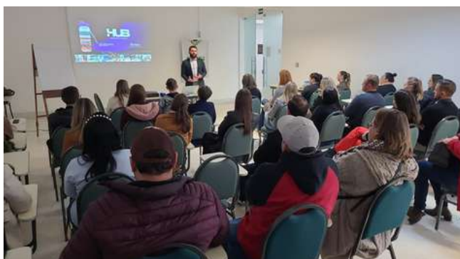
Palestra o Mentor de Negócios