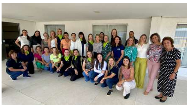
Reunião de integração no dia internacional da mulher

O Núcleo da Mulher Empresária da ACIC é um braço para promover assuntos de empreendedorismo feminino. Sem finalidade econômica lucrativa, política ou religiosa, rege suas atividades de acordo com o disposto no Estatuto Social da entidade.