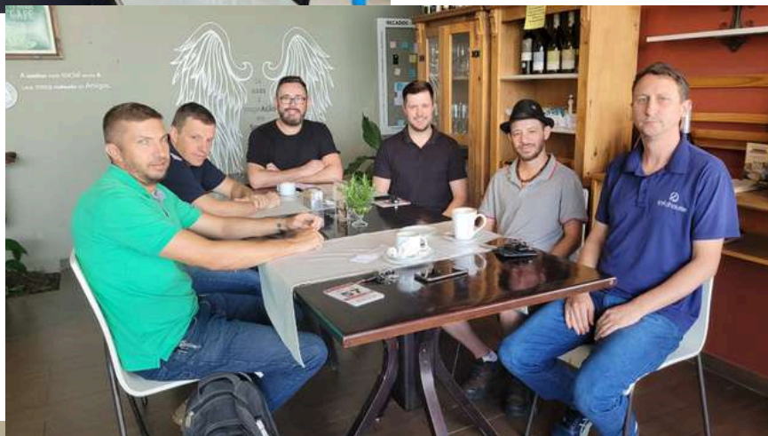
Reunião de trabalho.

Em reunião de empresários e instrutores do Projeto de Aceleração de Núcleos PAN, para alinhamento das ações.