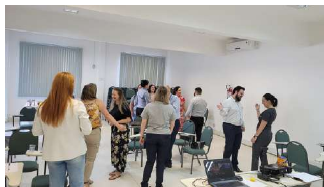
Dinâmicas de integração