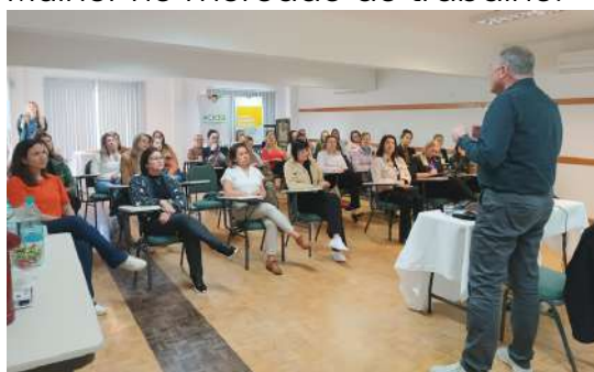
Palestra sobre oratória e o poder da comunicação.